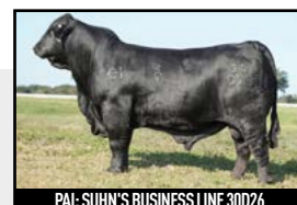
PAI: SUHN'S BUSINESS LINE 30D26

RANCHO 313 TE VPJ IA 262 APIPO OLHOS D'ÁGUA 5G 6779 DÁLIA