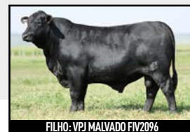
FILHO: VPJ MALVADO FIV2096