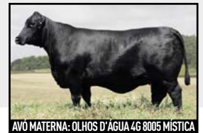
AVO MATERNA: OLHOS D'ÁGUA 4G 8005 MÍSTICA