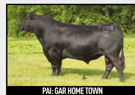
PAI: GAR HOME TOWN

G A R ASHLAND - IA1912 GAR HOME TOWN CHAIR ROCK SURE FIRE 6095 RM 3810-34 GAP H1180/11 GAP D532-D532