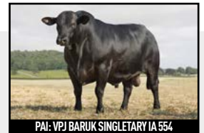
PAI: VPJ BARUK SINGLETARY IA 554

MC SOMETHING SPECIAL 889Y2 VPJ FIV 137 SOMETHING OLHOS D'ÁGUA 4G 8005 MÍSTICA