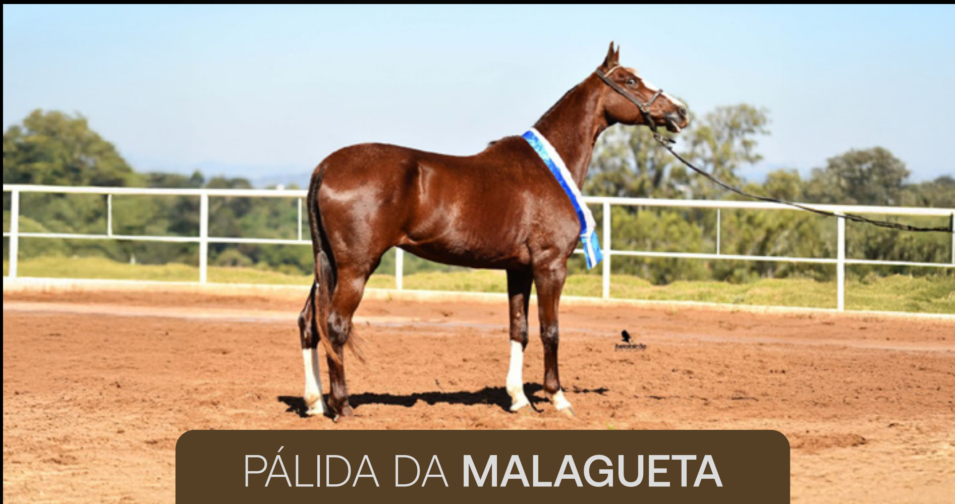
PÁLIDA DA MALAGUETA