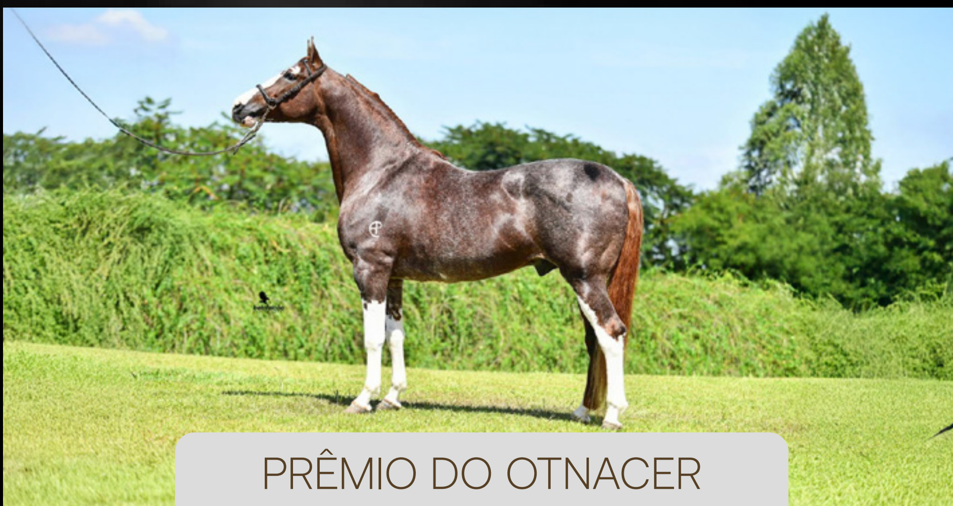
PRÊMIO DO OTNACER