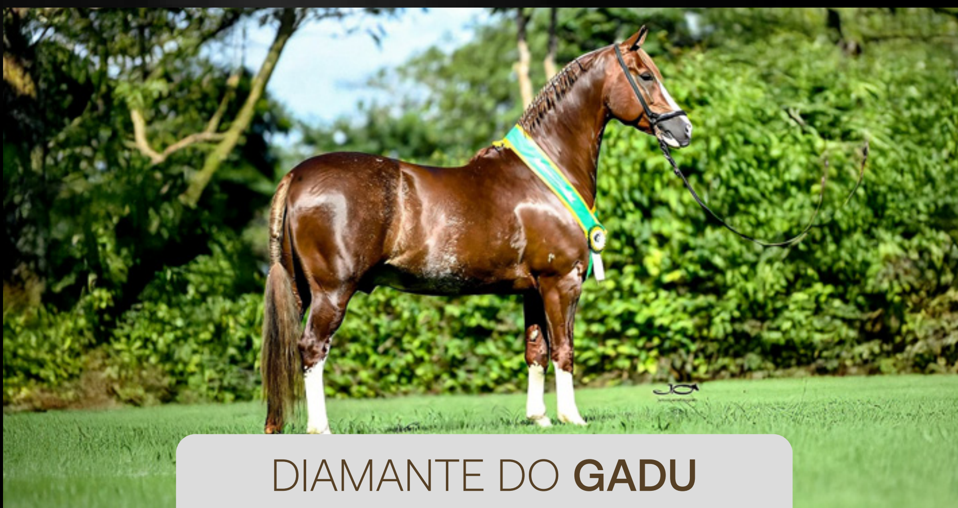
DIAMANTE DO GADU