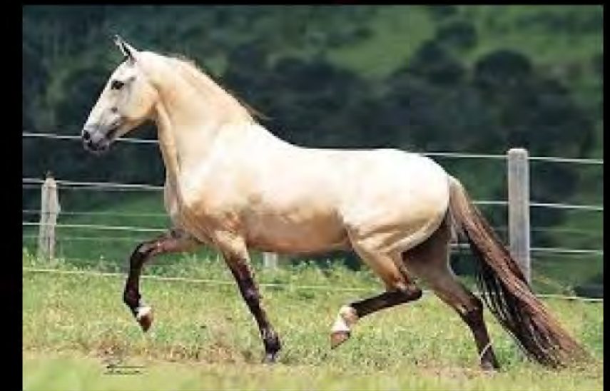
SUA AVÓ, SAFIRA DO BERMA