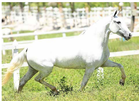
POR HARMONIA ACAUÃ