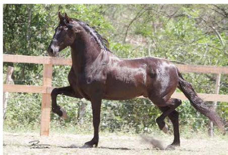
JABUTI DA MANDASSAIA