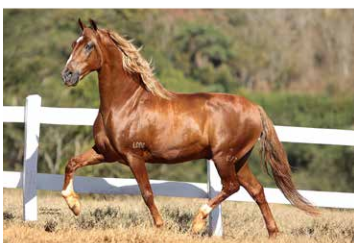
ESTANHO DE ALCATÉIA