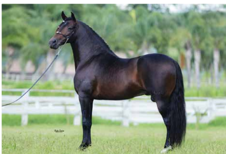
QUERUBIM DE ALCATÉIA