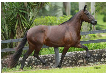
FATOR DA CAVARÚ-RETÃ