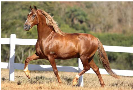
ESTANHO DE ALCATÉIA