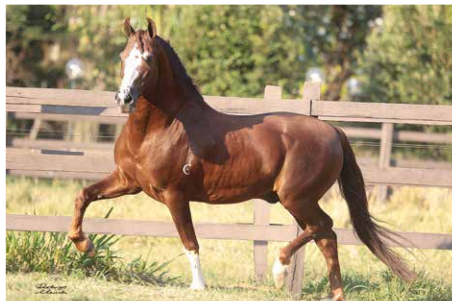
GALANTE DO EXPOENTE