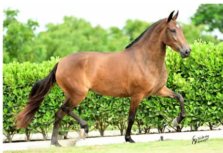
RUTH PORTEIRA AZUL