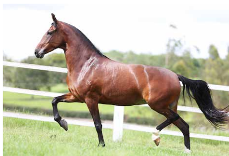
UÉSSICA DO CONFORTO