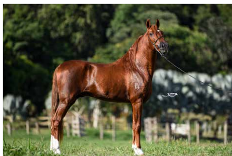
DIAMANTE DO CALAMBAU