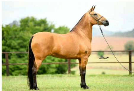
ALAMEDA DE TRÊS CORAÇÕES