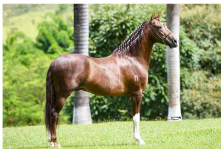
MONARCA DE ALCATÉIA