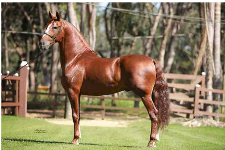
ATREVIDO DO YURI