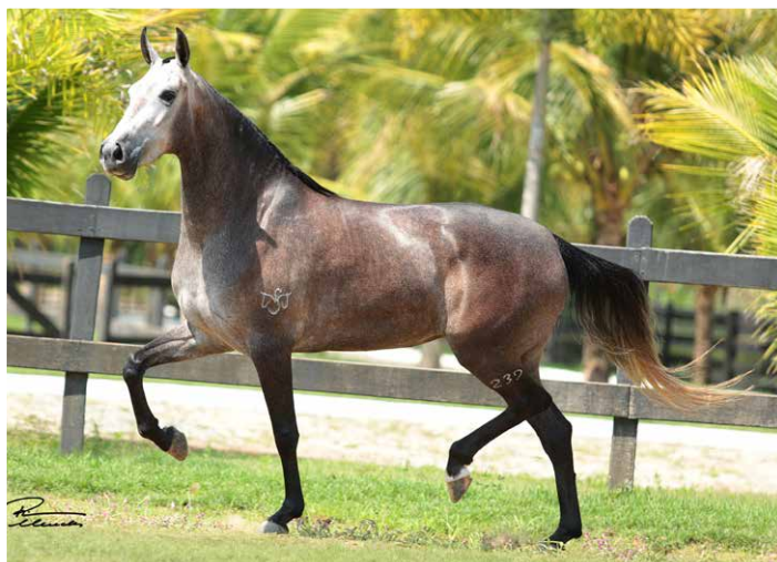
POR CHAMPAGNE SAPECADO