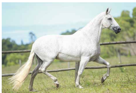
XULA JB DA OGAR