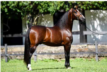
DAMASCO DA PAO GRANDE