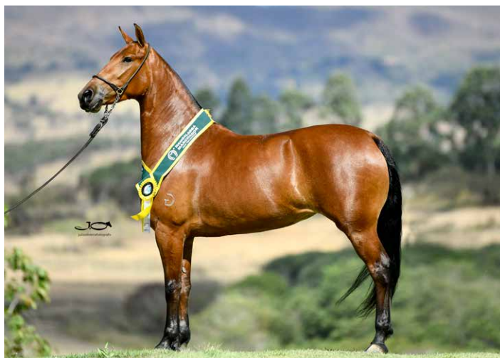
POR OUSADIA DA ALDEIA