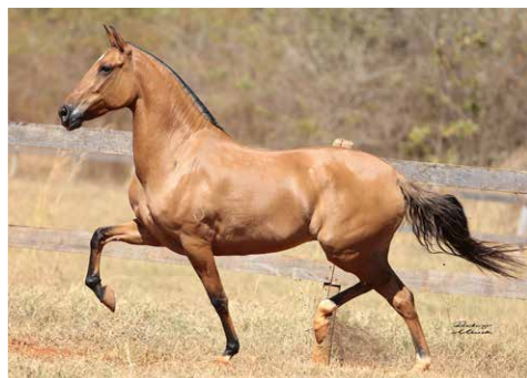
POR JUTA DO CARDEAL