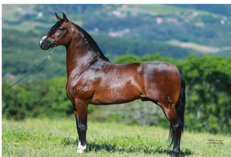
LÚCIDO DA FIGUEIRA