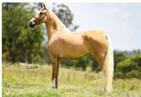
JACARANDÁ DE ALCATÉIA