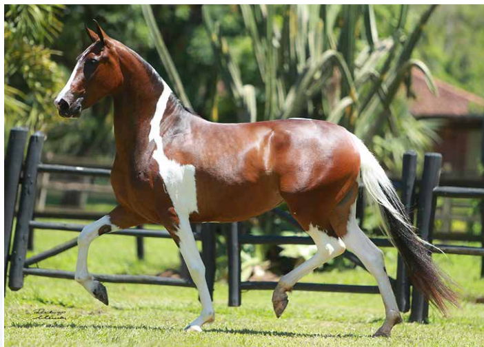
POR BARONESA IANU