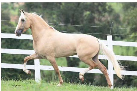
ZINABRE CALAMBAU I