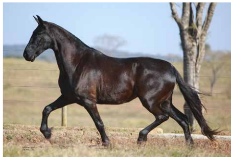
ZAMBOA DO PASSO FINO