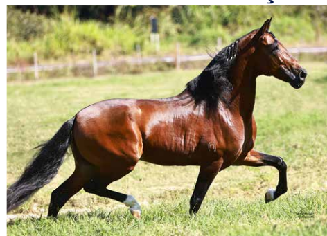
POR RENÚNCIA DE TRÊS CORAÇÕES