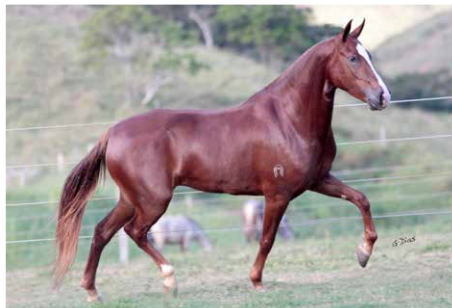
UNIÃO DO TUCUNARÉ