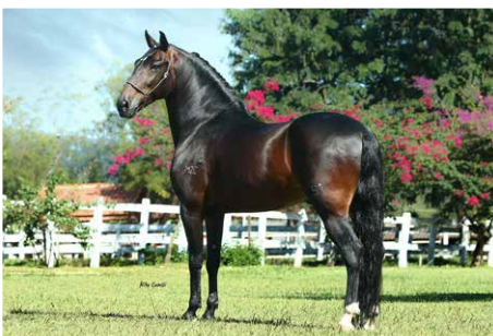
KAMIKAZE DO MZC