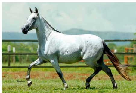
BALALAIKA LUA DE PRATA