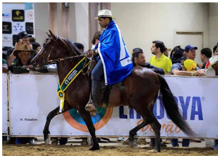
POR CACHAÇA DUAS BARBAS