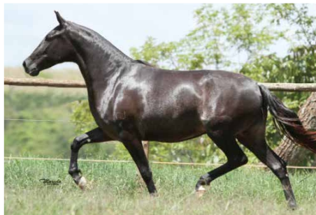
GAIVOTA DA PONTE NOVA