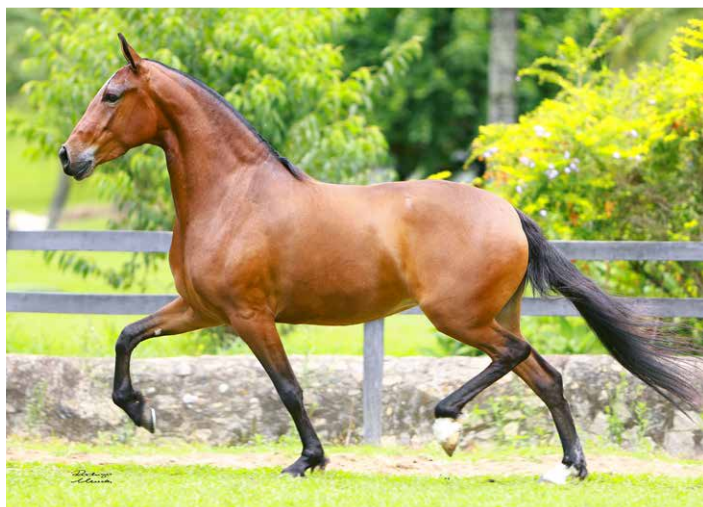
POR NARA DO BRASIL