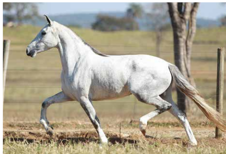
JOIA MORRO DO SOL NASCENTE