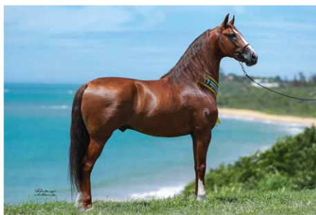
FAJARDO DO TIMBÓ