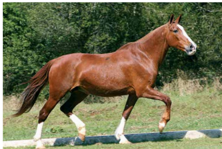
ELETRA DE GUARANTÃ