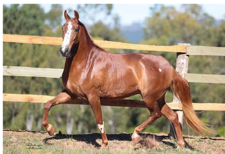
DEVASSA LUA DE PRATA