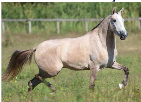
POR XERETA DO PAU DA ROLA