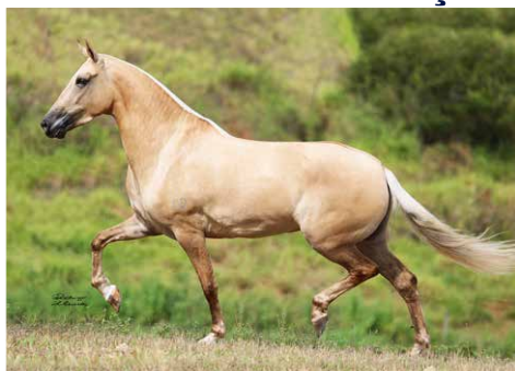
POR ASA BRANCA J.S.P.