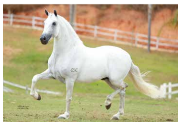
NOBRE CRISTAL PVB