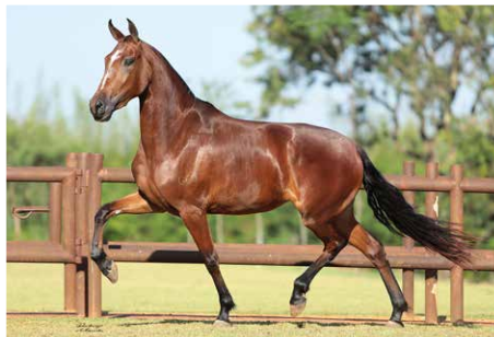
COMARCA DA SANTA ESMERALDA