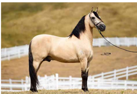
JOGO DE ALCATÉIA