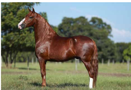
ATREVIDO DA MORADA NOVA