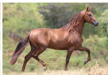
NEMO PORTEIRA AZUL