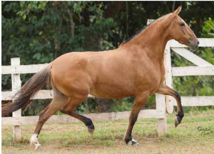
AYALA DO NOVO BOSQUE