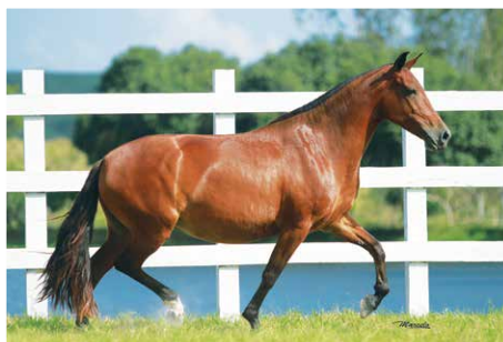
PINTURA DO FAROL