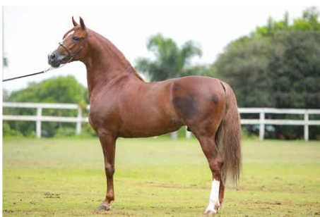
ESTEIO DE TRÊS CORAÇÕES