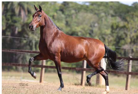
TENTAÇÃO DO YURI