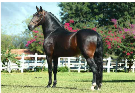
KAMIKAZE DO MZC