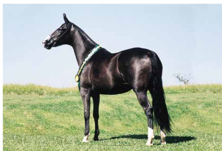
ONDA DOURADO S.M.