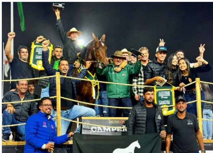
POR CHOPEIRA DO CONFORTO