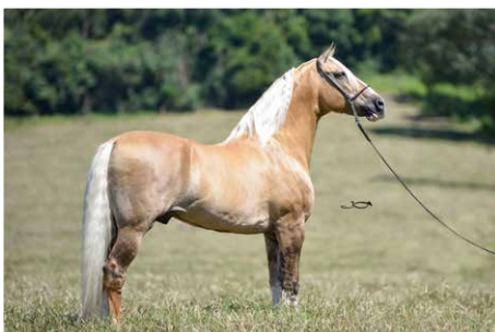
FATOR DA CAVARÚ-RETÃ