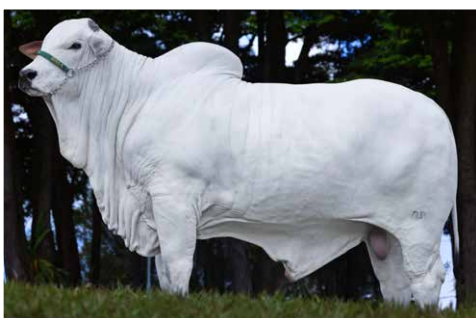
SEU FILHO RIMA FIV REQUINTE

Salina e mãe do touro RIMA FIV REQUINTE, Grande Campeão da Expo Zebu 2022. No time de pista da Casa Branca tem um outro filho da Salina que estreia agora na EXPOINEL.