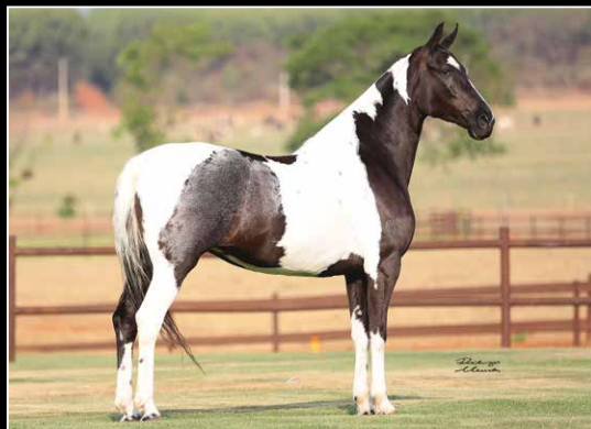
SUA AVÓ MATERNA