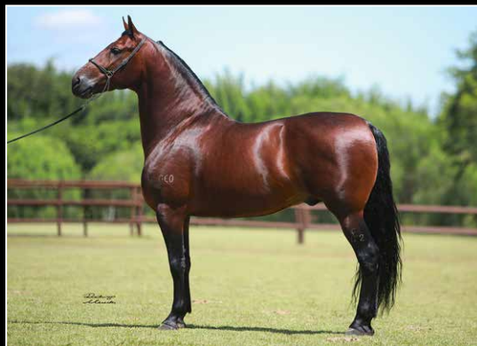
PRENHEZ EM 11/03/2025