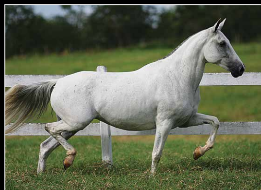
SUA AVÓ MATERNA