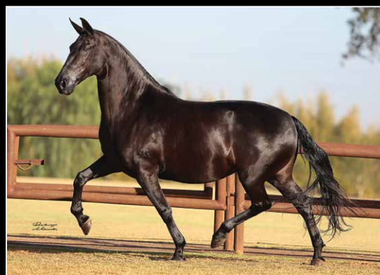
SUA AVÓ MATERNA