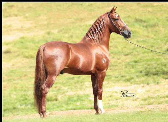
PRENHEZ EM 17/03/2025