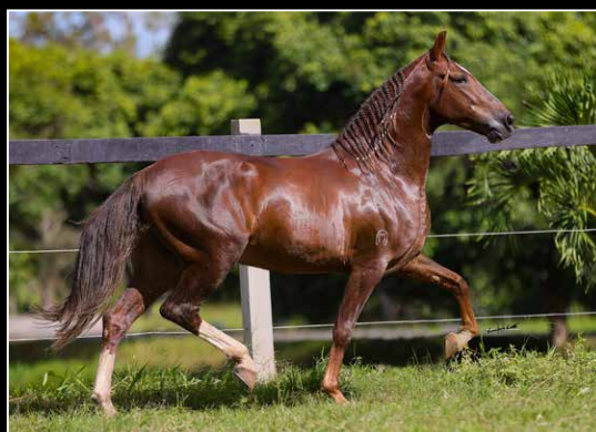
PRENHEZ EM 18/12/2024