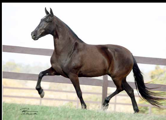
SUA AVÓ MATERNA