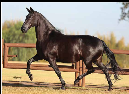
SUA AVÓ MATERNA