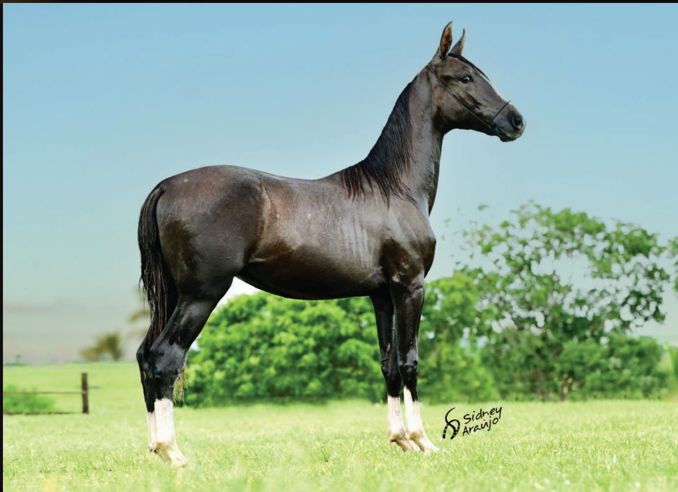
Seu pai PIMPOLHO E.A.O.