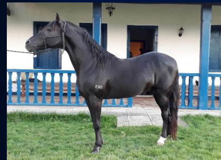
SEU PAI: GOMO E.A.O.