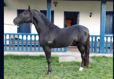
POTRO NETO DE GOMO E.A.O.