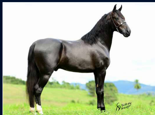
SEU AVÔ MATERNO VALENTE DA RIOCON