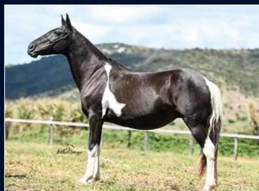
SUA AVÓ MATERNA GRAVIOLA DO HORTO CAXAMBUENSE