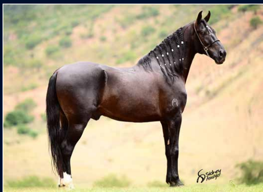
SEU PAI VALENTE DA RIOCON