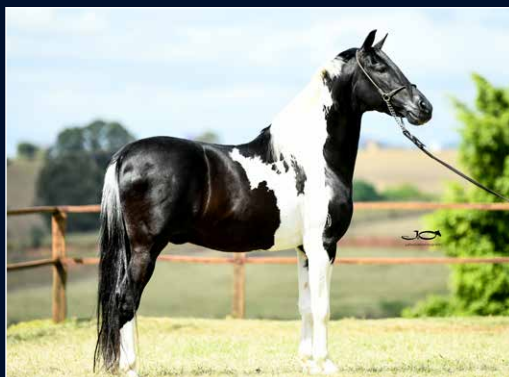
SEU AVÔ PATERNO JUSTO DO PORTO AZUL