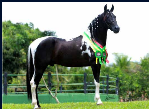
SEU PAI NEGRESCO CCR