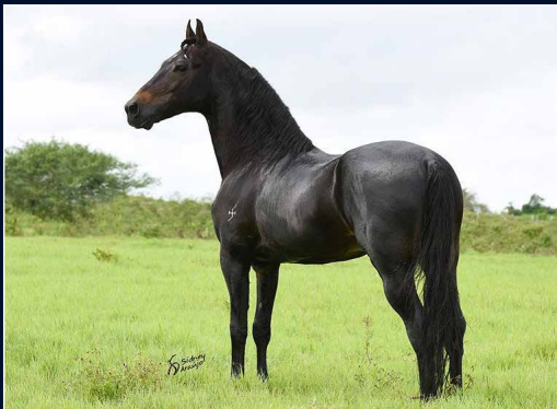
SEU PAI MARECHAL DO SAUÍPE

PRENHEZ POR VALENTE DA RIOCON EM 07/04/2026