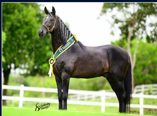
SEU AVÔ PATERNO IRAQUE PONTAL OK