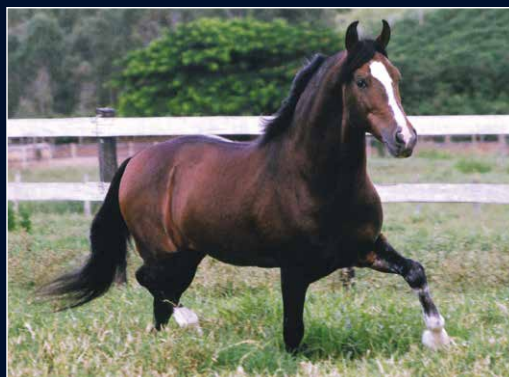
SEU AVÔ PATERNO FAVACHO ÚNICO