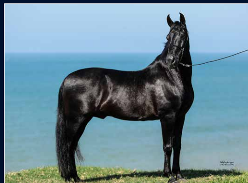
SEU AVÔ PATERNO EL CID DO PORTO AZUL