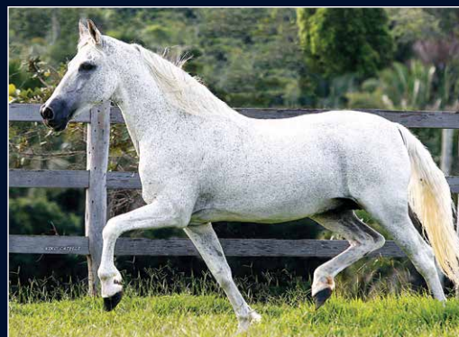
SEU AVÔ PATERNO NOBRE DE SANTA LÚCIA