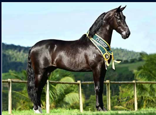
SEU PAI BARAK DO KELNER