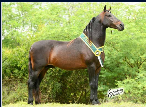
SEU PAI GAVIÃO DAS CARAÍBAS