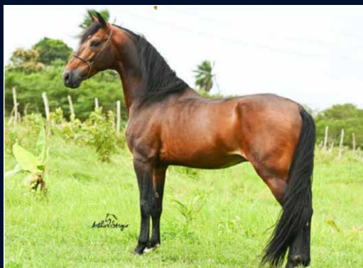
SEU PAI GARIMPO DO CALULI