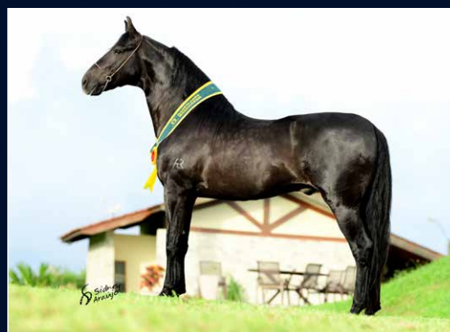
SEU AVÔ MATERNO TIMONEIRO DA RIOCON