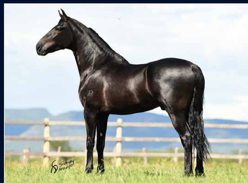
SEU AVÔ PATERNO RABINO DA RIOCON