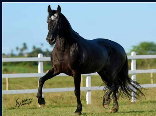
SEU AVÔ PATERNO ELFO DO PORTO AZUL