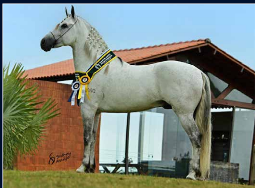
SEU PAI INGO DO CAVALEIRO