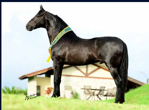
SEU PAI TIMONEIRO DA RIOCON