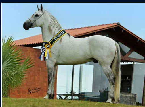
SEU PAI INGO DO CAVALEIRO