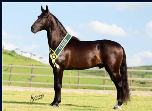
SEU PAI NERO RODEIO DO CAVALEIRO