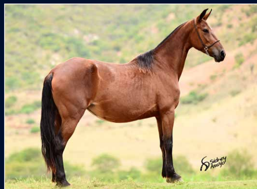
SUA MÃE DANÇARINA BOA FEIRA