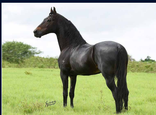
SEU AVÔ PATERNO MARECHAL DO SAUÍPE