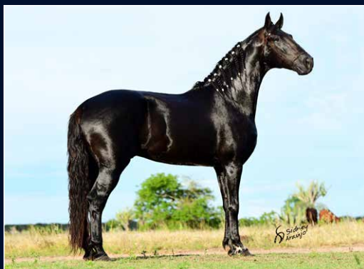
SEU PAI INGLÊS DO MONTEIRO