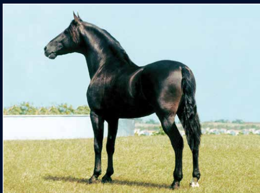
SEU AVÔ MATERNO LAMPEÃO HO