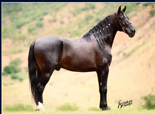
SEU PAI VALENTE DA RIOCON