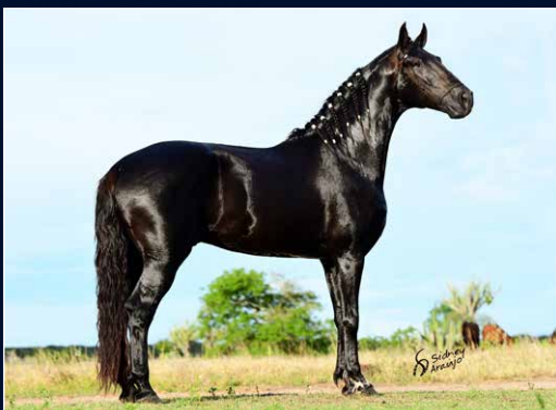
SEU PAI INGLÊS DO MONTEIRO